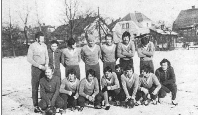
JISKRA JAROMĚŘ A MUŽSTVO 1972