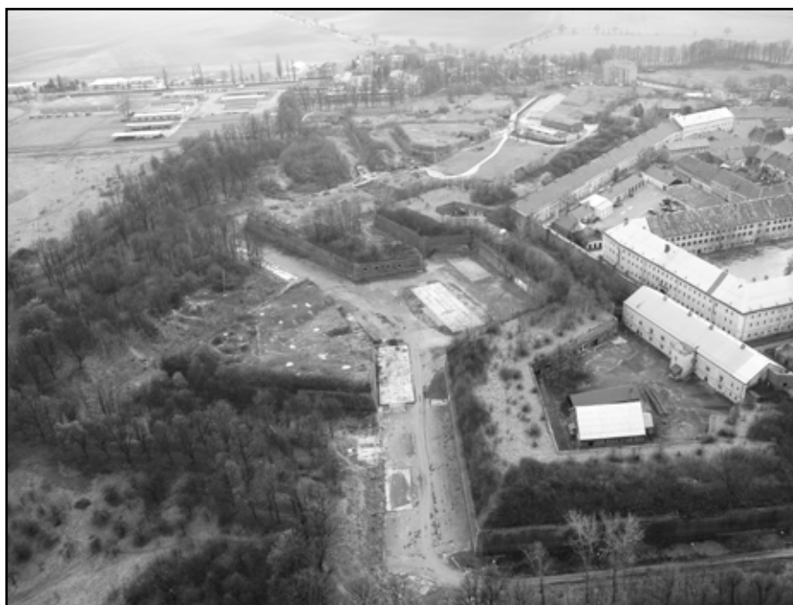
Ravelin XIII (bývalý autopark) v Josefově je připraven na první kulturní akci v letošní sezoně.

Radnice - Zpravodajství - Kultura - Mládež - Zajímavosti - Sport - Fotostrana