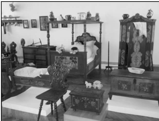
Výstava je otevřena do 29. června.

Na ochoze galerie je instalována výstava jaroměřského Fotoklubu. Autorem loga k muzejnímu výročí je akademický malíř Jiří Škopek.